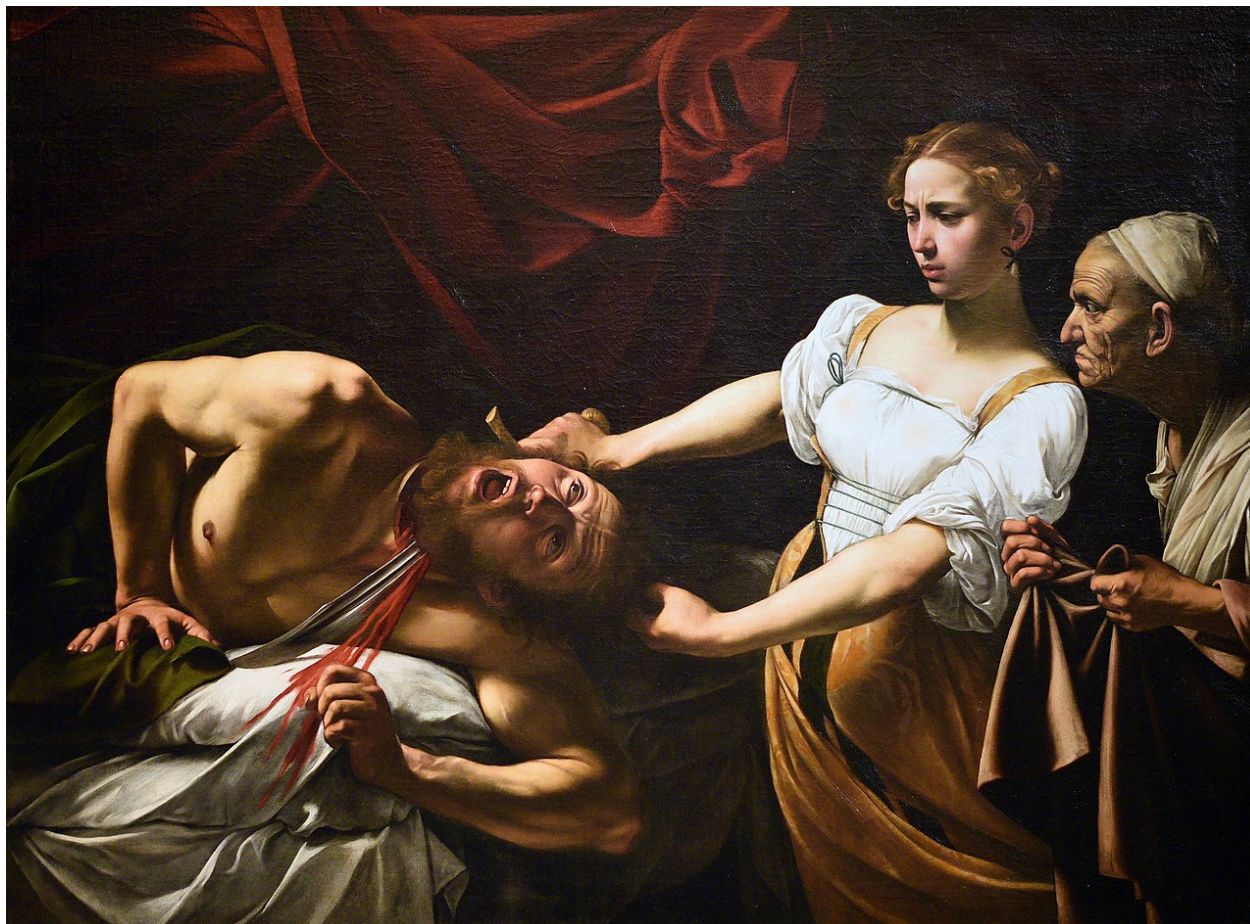
Микеланджело да Караваджо. Юдифь и Олоферн. 1599.

Перед вами две картины, раскрывающие сюжет о Юдифи и Олоферне. Проанализируйте сходство и различия этих произведений. Порассуждайте о стиле художников и особенностях эпохи Барокко.