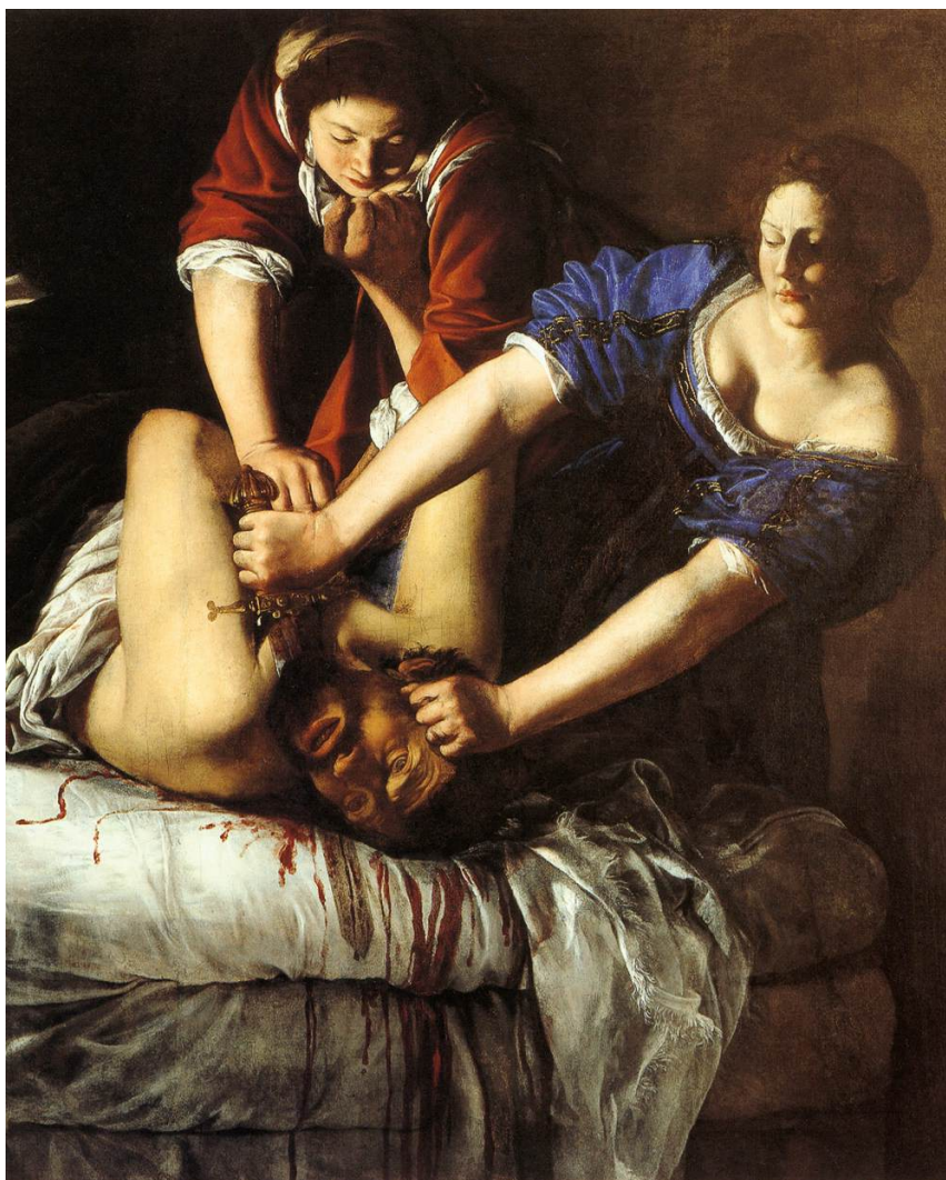
Артемизия Джентилески. Юдифь и Олоферн. 1611-1612.